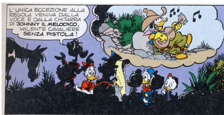
Figura 8: Il primo "racconto attorno al fuoco" di Nonna Papera. ("Il bel cavaliere e la regina del lago perduto", I TL-1782-A, 1990.)