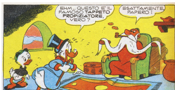
Figura 5: Nella dimora del romito. (“Zio Paperone e il tappeto propiziatore”, I TL 822-B, 1971.)

Da queste storie notiamo un altro importante aspetto della filosofia narrativa di Cimino: le sue storie, senza essere petulanti, sono buone da un punto di vista morale. A Cimino riesce di inventare belle trame che incorporano una fondamentale idea essenziale di equità e giustizia, senza per ciò rovinarle con il melenso sapore del moralismo o della religiosità. Le sue storie non sono necessariamente tutte