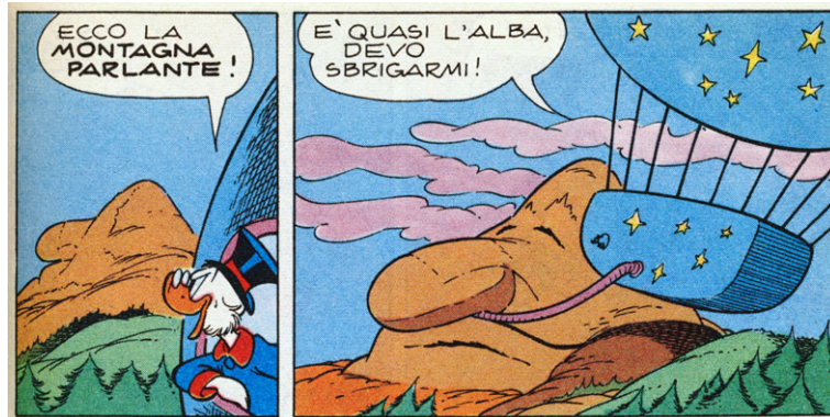
Figura 1: Una suggestiva e geniale storia di Cimino splendidamente illustrata da Scarpa. ("Zio Paperone e la montagna parlante", I TL 695-A, 1969.)

E allora, chi scriveva le storie di Scarpa quando le matite del Maestro avevano raggiunto il massimo della qualità? L'onnipresente Martina, potreste supporre. Beh, in realtà no. Certo, Martina continuava a produrre un gran numero di storie, fra cui molte bellissime, e alcune di queste arrivavano sul tavolo da disegno di Scarpa (si veda ad esempio l'ottima "Topolino e il terribile Kala-Mit" (I TL 610-AP, 1967), in cui Pippo diventa leggero come l'aria e capace di leggere il pensiero—facoltà utili contro il cattivo della storia che ricatta la terra e ruba ingenti