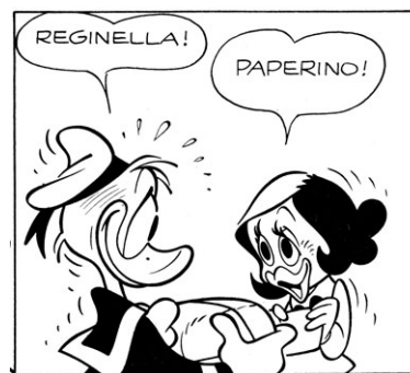
Figura 10: Ricongiunti dal destino. ("Paperino e il ritorno di Reginella", I AT 213-A, 1974.)