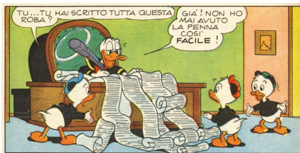
Figura 2: Improvvisamente grafomane. ("Zio Paperone e l'avvoltoio grifone", I TL 775-A, 1970.)

Questa storia ci illustra alcuni dei temi preferiti di Cimino: Paperone che scopre antichi documenti che parlano di vecchi tesori e, di conseguenza, i paperi che viaggiano verso terre lontane e incontrano popoli primitivi. Cimino rappresenta queste culture primitive con grande amore e rispetto: in molte di queste storie i paperi incontrano un vecchio il quale, sebbene parli solo il primitivo linguaggio di un Tarzan, finisce col dimostrare loro che la saggezza del suo antico popolo, magari coadiuvata da un pizzico di magia che la scienza moderna non comprende, vale più della tecnologia e della ricchezza dei nostri eroi paperopolesi. Alcuni begli esempi in questo filone si trovano nelle seguenti storie.