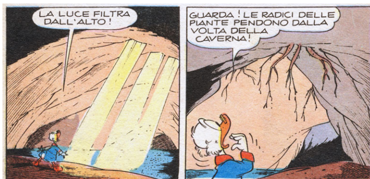
Figura 3: Le radici nel cielo. ("Zio Paperone e le montagne trasparenti", I TL 831-A, 1971.)

In "Zio Paperone e il tappeto propiziatore" (I TL 822-B, 1971), disegnata da Bordini, un vecchio eremita dalla lunghissima barba bianca possiede uno speciale tappeto che rende ragionevoli le persone aggressive. Paperone, che vorrebbe il tappeto per sé, incontra grandi difficoltà: non appena entra nella modesta casa dell'eremita (Fig. 5) e mette piede sul tappeto, diventa egli stesso "ragionevole" e si convince che il tappeto va lasciato al suo naturale proprietario.