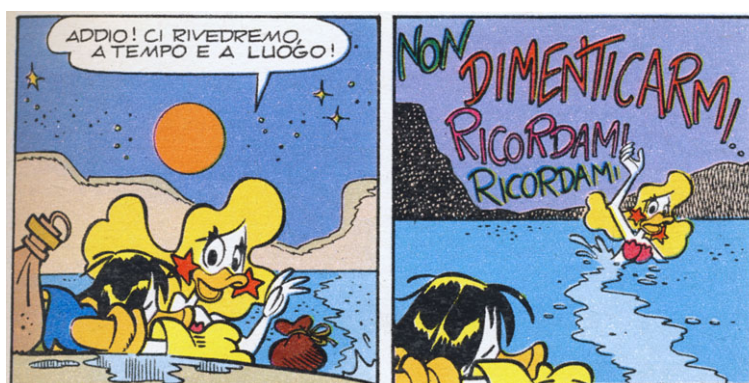
Figura 9: Tristissimo addio. ("Il bel cavaliere e la regina del lago perduto", I TL-1782-A, 1990.)

Ma, mentre canta la sua ultima canzone, accade un miracolo: l'acqua del lago perduto ricompare e, con essa, una stupenda sirena, regina del lago. Johnny e la sirena si innamorano, ma il lago è geloso: con un terribile temporale il lago rapisce Johnny, che la regina riesce a salvare solo promettendo al lago che lascerà il cowboy. Il lago allora si ritira e sparisce, portando con sé la regina e lasciando Johnny privo di sensi in