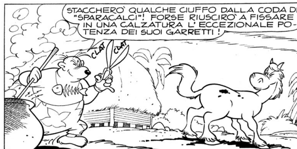
Figura 6: Lo stregone delle isole Fiji al lavoro per Brigitta. (“Zio Paperone e le scarpe integrate”, I TL 792-A, 1971.)

Paperone offende Brigitta; questa per vendicarsi si associa con Sganga e batte Paperone sul fronte commerciale; Paperone deve arrendersi; infine Brigitta smette di fare concorrenza a Paperone purché in cambio questi le dedichi regolarmente del tempo), ossia “Zio Paperone e il maleficio blu” (I TL 686-A, 1969), anch'essa disegnata da Scarpa, la concorrenza avviene nel campo dei gioielli (Fig. 7). Paperone invoca oscure leggi al fine di rubare legalmente una misteriosa pietra blu dalla gioielleria di Brigitta e Sganga; ma questa azione gli si ritorce contro poiché la maledizione della perla tramuta in polvere le sue altre pietre preziose.