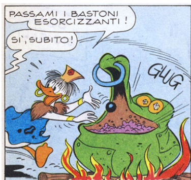
Figura 7: L'amica africana di Brigitta prepara un gioiello speciale. (“Zio Paperone e il maleficio blu”, I TL 686-A, 1969.)

Le udienze in tribunale sono in effetti un altro leitmotiv di Cimino: coerentemente con il tema fondamentale di “giustizia cosmica” evidenziato più sopra, i giudici sono generalmente rappresentati come dei saggi che finiscono sempre prima o poi con l'emettere sentenze giuste. Per mantenere il realismo della storia, capiterà che un capitalista come Paperone (o magari Rockerduck) possa permettersi costosi avvocati capaci di interpretare la legge in suo favore, e che il giudice debba a malincuore ratificare la tesi dell'avvocato; tuttavia, nell'universo di Cimino, la stessa legge di cui Paperone richiede l'applicazione per incastrare il suo povero antagonista spesso si ritorcerà contro di lui come una lama a doppio taglio. Si noti che l'antagonista non è sempre necessariamente Paperino: in molte ottime storie Cimino mette Paperone di fronte alle iniziative commerciali di Brigitta e Filo Sganga.